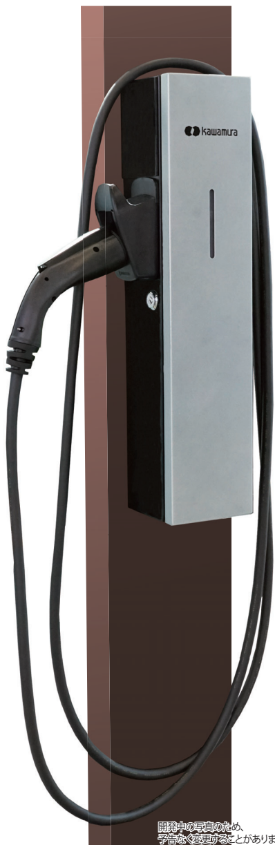
開発中の写真のため、予告なく変更することがあります。